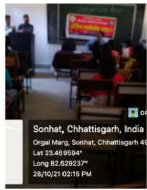
Sonhat, Chhattisgarh, India Orgai Marg, Sonhat, Chhattisgarh 49735, India Lat 23.469594° Long 82.529237° 28/10/21 02:15 PM