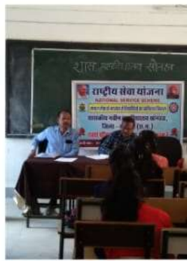
Sonhat, Chhattisgarh, India Stadium Rd, Sonhat, Chhattisgarh 49735, India Lat 23.477629° Long 82.519429° 28/10/21 02:08 PM