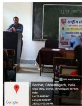
Sonhat, Chhattisgarh, India Orgai Marg, Sonhat, Chhattisgarh 49735, India Lat 23.469594° Long 82.529237° 28/10/21 02:08 PM