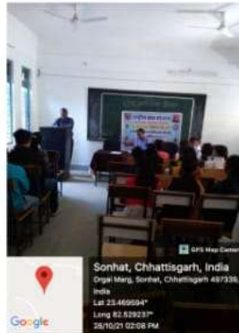
Sonhat, Chhattisgarh, India Orgai Marg, Sonhat, Chhattisgarh 49735, India Lat 23.469594° Long 82.529237° 28/10/21 02:08 PM