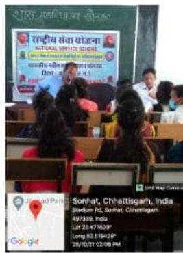
Sonhat, Chhattisgarh, India Stadium Rd, Sonhat, Chhattisgarh 49735, India Lat 23.477629° Long 82.519429° 28/10/21 02:08 PM