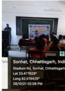
Sonhat, Chhattisgarh, India Stadium Rd, Sonhat, Chhattisgarh Lat 23.477629° Long 82.519429° 28/10/21 02:08 PM