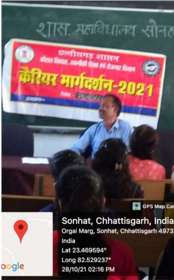
Sonhat, Chhattisgarh, India Orgai Marg, Sonhat, Chhattisgarh 49735 India Lat 23.469594° Long 82.529237° 28/10/21 02:16 PM