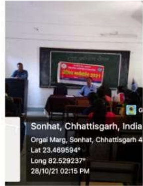
Sonhat, Chhattisgarh, India Orgai Marg, Sonhat, Chhattisgarh 49735 Lat 23.469594° Long 82.529237° 28/10/21 02:15 PM