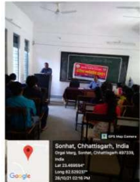
Sonhat, Chhattisgarh, India Orgai Marg, Sonhat, Chhattisgarh 49735, India Lat 23.469594° Long 82.529237° 28/10/21 02:16 PM